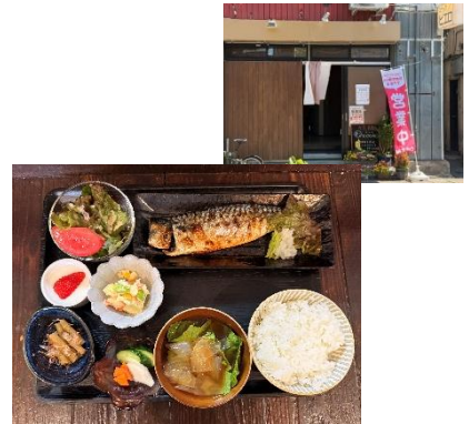
[紹介者 おやつ屋 nuage さん]