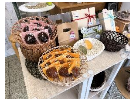
[紹介者 啓文社印刷(有)さん]