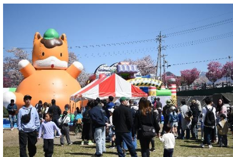
子どもたちに大人気のフワフワ