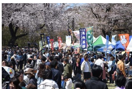
大盛況の飲食ブース