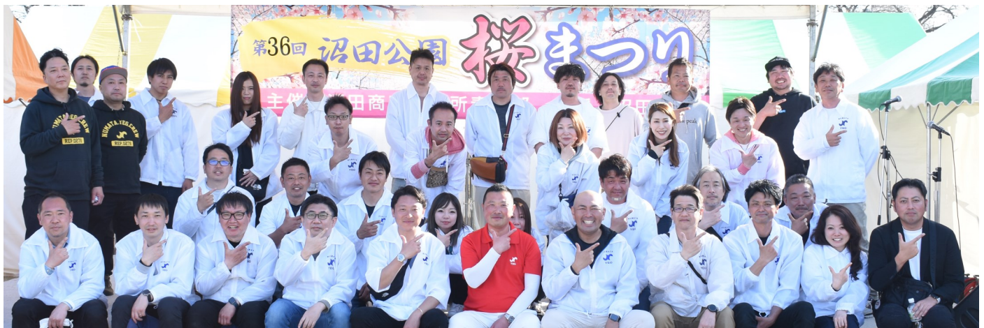
イベントを終えた青年部メンバー