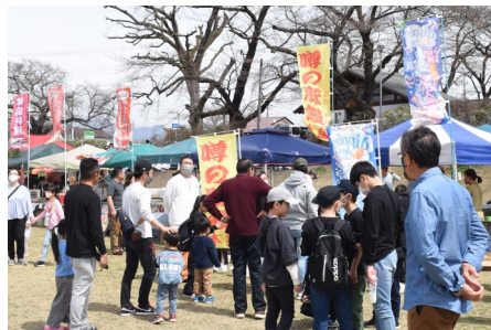
来場者で賑わう店舗