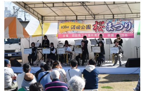
市内高校生による演奏