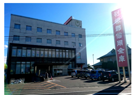
利根郡信用金庫 本店営業部

今やデジタル化が進み時代とともに進化が必要で、難しい舵取りだと感じていますが、地域と中小企業の成長・発展に貢献すべく全力を挙げて邁進してまいります。