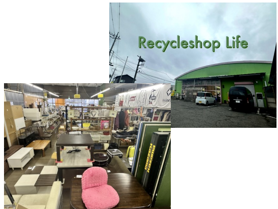
＜紹介者 (有)戸丸工務店さん＞

掘り出し物の商品や一点物の商品等魅力ある商品が多数ございますので、是非足を運んでいただければと思います。