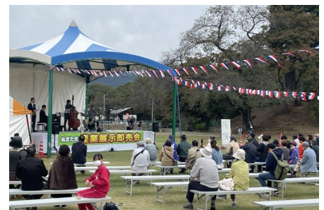
10/7.8 ぬまた市 産業展示即売会