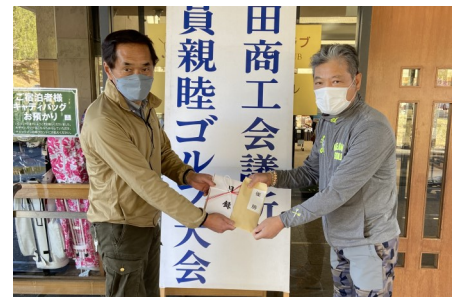
4/12 会員親睦ゴルフ大会