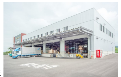
本社（沼田市久屋原町241-1）

急激な人口減少・少子高齢化・コロナ後の生活様式の変化で、日々『変わる』ということに、知恵と汗をかいております。『大変』という言葉が言われる方がいますが、私は『大きく変わる』まさにピンチはチャンスと思っています。ダーウィンの進化論ではないですが、大きいものが勝つのではなく、『変化』に対応していけるものが、長く生き残れるのではないかと考えております。幸い弊社の業界は人が生活していくうえで必要な日用品雑貨を扱っており、「売り物」「売り先」「売り方」を創意工夫していく事で、まだ、業界的に貢献できていると考えております。人の満足が大きいほど、企業は繁栄し、生産性をあげ、業種から業態化に変化していくことが『長生きさせる秘訣』だと思っています。