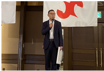
6/27 ベストアクション表彰