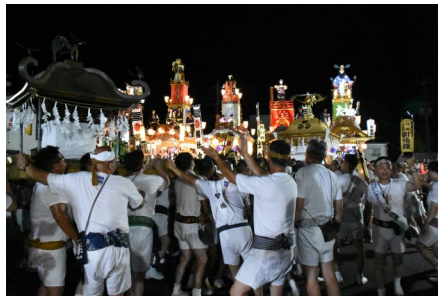
8/3～5 4年ぶり開催、沼田まつり