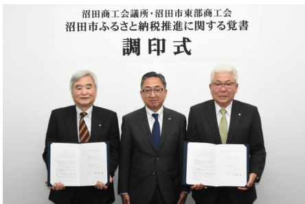
4/3 ふるさと納税推進に関する 覚書調印式