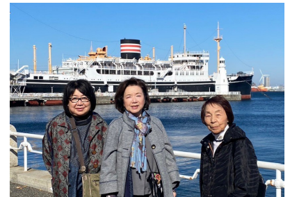
【↑マリントワー展望台を見学後、山下公園を散策しました】