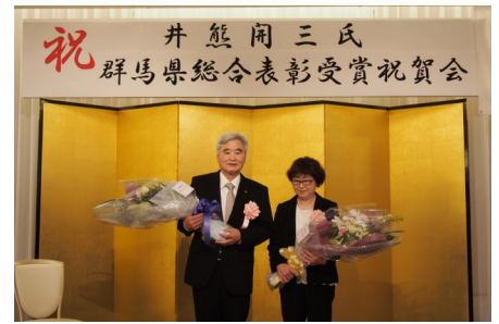
7/10 群馬県総合表彰受賞 祝賀会