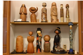
創作こけしの展示