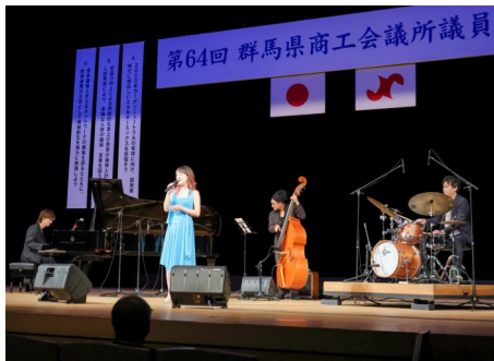
ジャズライブの様子