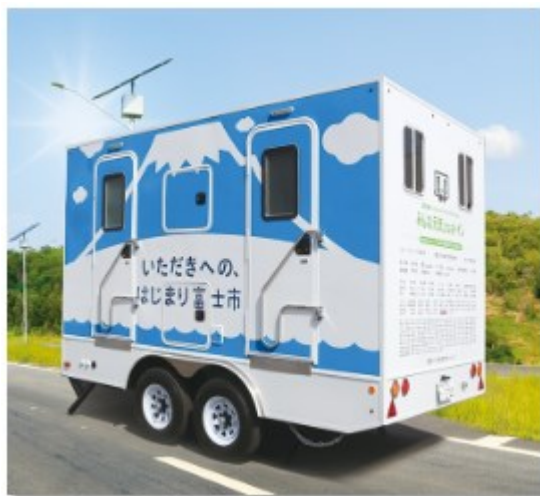
※画像は富士市仕様のものです。

※熊本地震では、直接死50人に対し、避難生活などの心身負担が原因で81人が亡くなりました。