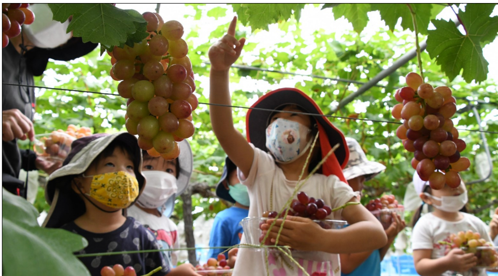
【開園式にてぶどう狩りを楽しむ保育園児たち】

発行人：沼田商工会議所 専務理事 中村 一喜 〒378-0044 群馬県沼田市下之町888テラス沼田7階 TEL 0278(23)1137 http://www.numata-cci.or.jp FAX 0278(24)0715 E-mail info@numata-cci.or.jp 企画編集：広報委員会