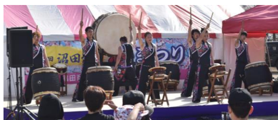
【ステージイベント（手九野太鼓）】

2年ぶりに開催された沼田公園桜まつり（ライトアップ期間：令和4年4月1日～4月18日）は大盛況のうちに幕を閉じ、最終的な来場者数はのべ8千人でした。