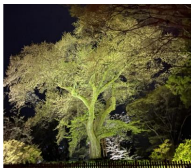
【御殿桜ライトアップ】

例年より規模を縮小したライトアップでしたが、鐘楼や御殿桜が闇夜に美しく照らし出されると、公園を訪れた方々から感嘆の声が聞こえました。