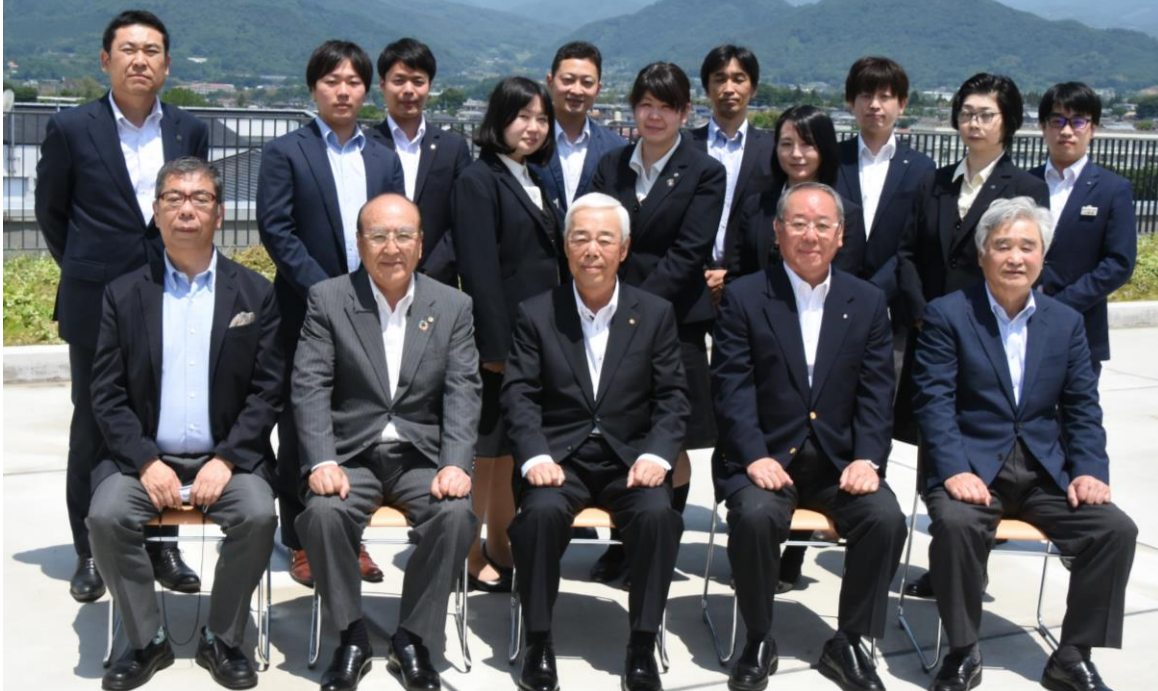
【沼田商工会議所 正副会頭・職員一同】

沼田商工会議所の活動には、みんなで力を合わせて住みよい社会にしたいという念願が込められています。「総合的な地域振興」を視点に、商業・工業・観光・サービス業などの更なる発展と強化を目指して参ります。