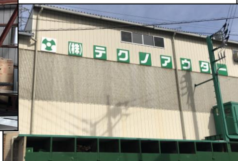
【本社および屋根材を加工する工場】