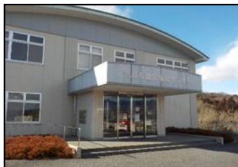
渋川市勤労福祉センター