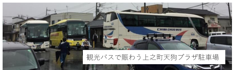
観光バスで賑わう上之町天狗プラザ駐車場

GOTO トラベルや GOTO イート、GOTO 商店街など街に活気を取り戻す試みが始まっています。