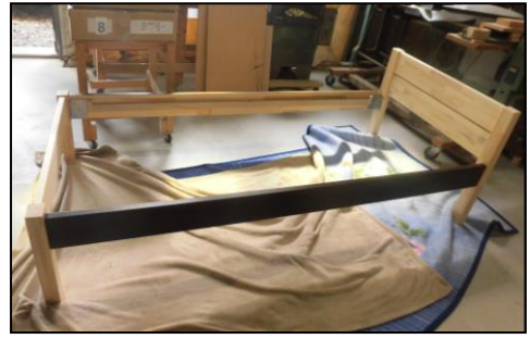
【ふとんのおうちさんとのコラボベッド】

今現在「ふとんのおうち」さんとのコラボ企画としてベッドを共同開発しています。2ヶ月ほど前にこちらから声をかけて実現しました。弊社がベッドのフレームから簧の子まで作成し、おうちさんがマットレスなどを販売します。注文が確定すると、おうちさんがお客様の自宅でベッドを組み立ててくれるという新しいサービスです。