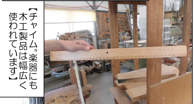
【チャイム。楽器にも木工製品は幅広く使われています】