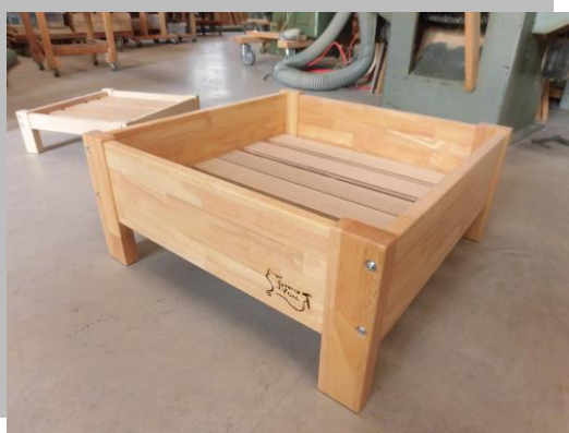
【オリジナルのネコ用ベッド。ざぶとんがすっぽり入るサイズです。側面のマークがアクセント♪】