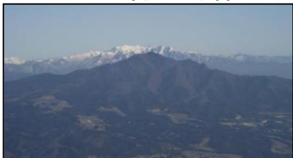
つつじが丘から見える子持山と武尊山