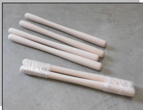
【太鼓のバチ。とても滑らかな握り心地です。太鼓奏者の方にぜひ使って頂きたい一品】