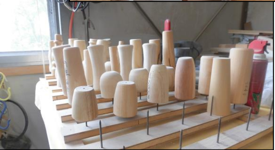
【ベッドの脚の部分。脚にも色々な形がありますね】