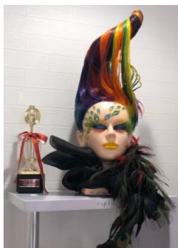
【最優秀賞を受賞した際の作品】