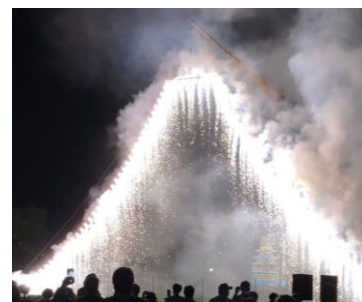
【ナイアガラ花火の様子】