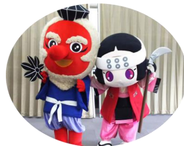
てんぐちゃん・小松姫 ~応援よろしくをお願いします~

小松姫とてんぐちゃんが「ゆるキャラ®グランプリ2019」にエントリーしました。前回より順位を上げられるよう頑張りたいと思いますので、皆様のご投票をお願いいたします。