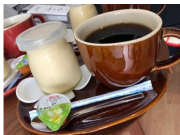
【美味しい手作りプリン】