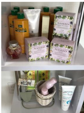
【オススメヘアグッズ】