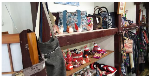
【店内には和風小物が並ぶ】