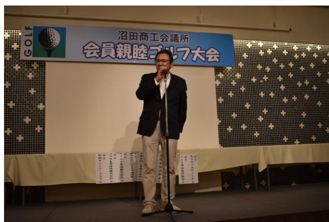
【優勝スピーチの様子】