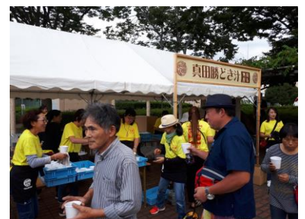
真田勝どき汁無料配布。今年は約5000食配布しました。