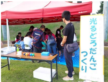
ワークショップでは、たくさんの大人や子供達で賑わっていました。