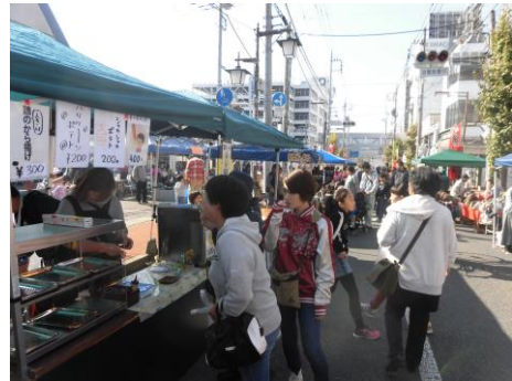
【昨年の系びす講の様子】