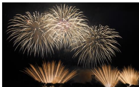
天候に恵まれた中、多くの方が花火の迫力を感じていたのではないのでしょうか。