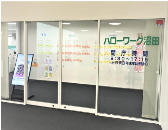
【テラス5階ハローワーク入口】

9月24日(火)よりテラス沼田5階に移転致しました。バスをご利用の方については市役所前で下車して下さい。車でお越しの方は立体駐車場をご利用下さい。