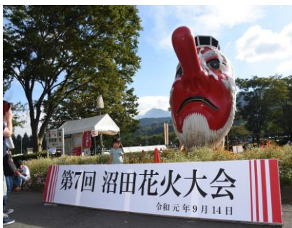
今年は会場入口に天狗面を立てて配置しました。多くの方が写真を撮っていました。