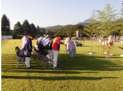
当日早朝に花火大会が無事に開催されるよう安全祈願祭を行いました。