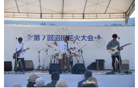
地域交流イベントでは、初の高校生バンドによる演奏やダンス、太鼓の演奏等の発表を行いました。