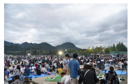
今年の来場者数は約80,000人でした。来年も皆様のご来場心よりお待ちしております。