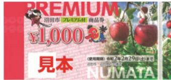
【プレミアム付商品券見本】

沼田市では、消費税・地方消費税率の10%への引き上げが低所得者及び子育ての世帯の消費に与える影響を緩和するとともに、地域における消費を喚起・下支えすることを目的に「沼田市プレミアム付商品券」を発行します。 是非、プレミアム付商品券取扱店にご登録いただきますようお願い申し上げます。