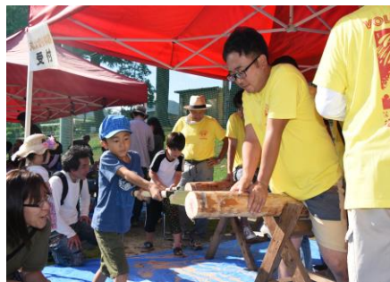
ワークショップと同じ会場で、丸太切り体験を行いました。