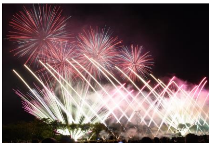
子供達の元気な掛け声で沼田花火が打ちあがりました。今年も榊丸玉屋さんの演出により行われました。