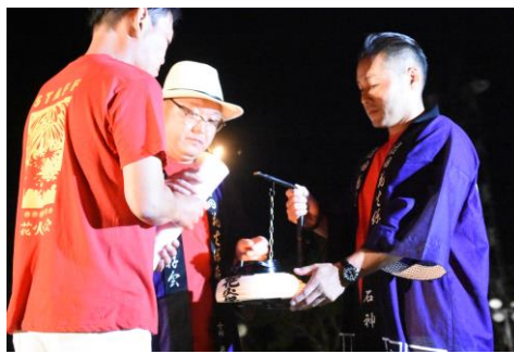
今年リレーイベントとして実施した「火まつり」で使用した火を、沼田花火保存会から沼田花火大会実行委員会へ繋ぐ、「火渡しの儀式」が行われました。