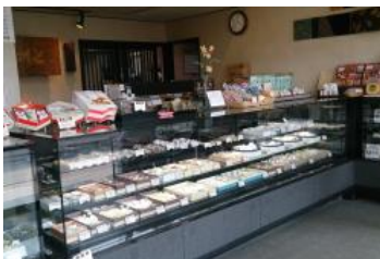
【清潔感の有る店内にきれいな和菓子がいっぱい並んでいます】