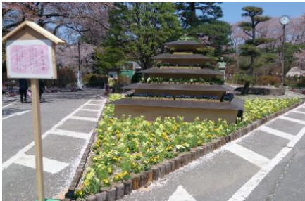
【沼田公園にて・・・ 入口のところに天守閣があります】

開催中はチューリップやツツジなどの季節の花に加え、市民参加で育てたビオラなど多くの花で会場を彩ります。開催期間中の土・日・祝日は、さまざまなイベントを同時開催していますので、是非お越し下さい。