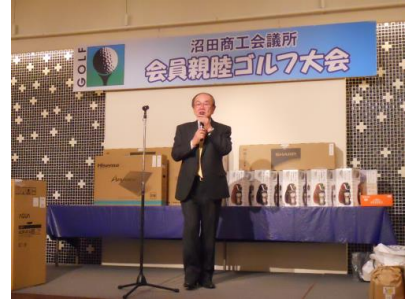
【宇敷会頭より、挨拶】