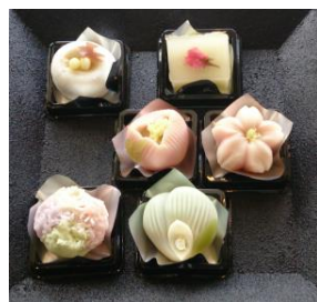
【かねもとさんの生和菓子は京都の人からも大人気です】