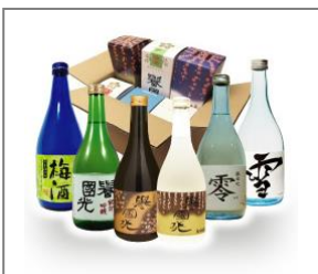
↑【土田酒造さんのレギュラー商品です】

「地元の方に、一番美味しいお酒を」です。地酒とは地元の方に支えられ、地元の方に「この酒があつて良かったな」と言って頂くことにあります。当蔵では、地元の方に飲んで頂ける晩酌のお酒の品質に徹底的にこだわって造っております。特にお酒の味に関わる、お米の磨きも晩酌酒としては全国的に珍しい4割削っております。もちろん寝泊まりをして見守っています。