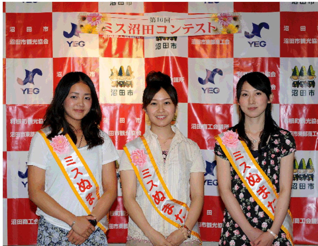
沼田まつりの詳細は3ページ～5ページに記載してありますのでご覧ください。

当会議所青年部主催による“2010ミス沼田コンテスト”が7月10日(土)ディランにおいて開催され、応募者24名の中から下記3名が選出されました。ミス沼田に選出された3名の方には沼田まつりや桜まつりをはじめとする諸行事においてビューティフルメッセンジャーとして沼田のPRに尽力頂きます。