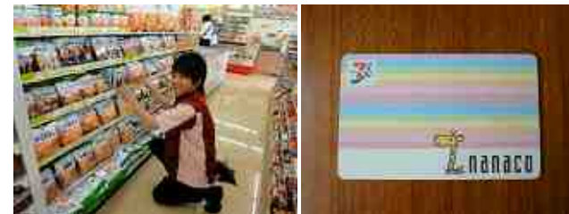
【並び方にもこだわっています】 【nanacoカードです】

この辺は、近くにスーパーがないので、車の運転が出来ない年配の方がスーパーの代わりに来ていただいています。ハムや豆腐などを買っていただくのでなるべく無くなる様に気を付けています。