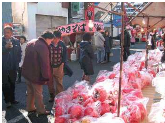
露天商によるだるま・縁起物などの露店販売を行います。