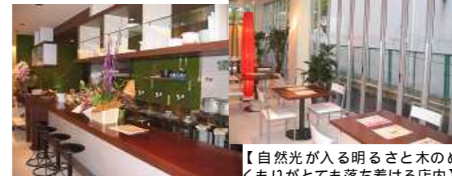
【自然光が入る明るさと木のぬくもりがとてもしずける店内】

あと、『Bear』の他に、サーティワンアイスクリームの取扱店もしているのですが、沼田のベシアにも入っていて、ベシアまで行けないというお客さんの為に、『Bear』の店内でも、サーティワンアイスクリームが食べられるようにしました。サーティワンアイスクリームを使ったオリジナルアイスクリームプレートもご用意しておりますので、是非食べてみてください。