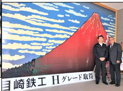
【地域貢献に関する展示室を見学させて頂きました！】