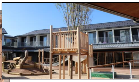
【アスレチックは街の公園としていつでも遊べます♪夏は水遊びも！？】