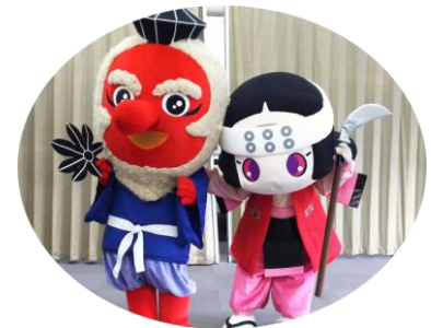
てんぐちゃん・小松姫 ～応援よろしく願いします～