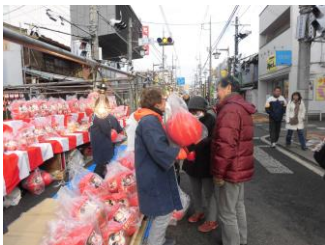
【↑写真は今年の沼田だるま市の様子】

1月16日(木) 本町通り(歩行者天国) ・露店出店:正午～午後7時まで(規制は8時まで) ・駐車場:テラス沼田立体駐車場(2時間まで無料) <<だるま供養>> 時間 午後2時～午後4時まで 場所 須賀神社境内 役目を終えた『だるま様』を焚き上げる神事。 午後1時30分までに須賀神社へ「だるま」をお持ち下さい。