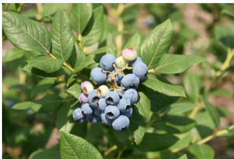
〔7・8月 フルーベリー〕