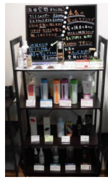
【様々な種類のシャンプー】