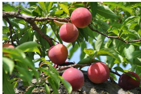
〔7・8・9月 サマーフルーツ〕