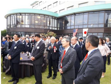
←【黒船祭に宇敷会頭が参加】