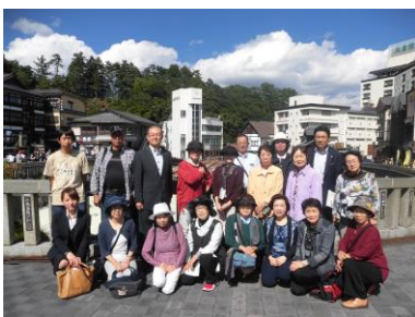
【当所諸業部会と女性会共催でハッ場ダム方面の視察研修会を行った】→