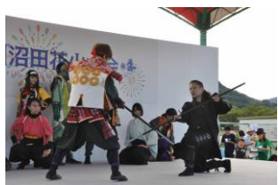
↑【盛り上がりを見せたステージイベント】