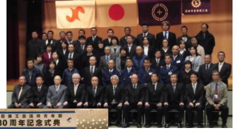
↑【会員事業所に継続して10年以上勤務し、他の模範と認められる従業員を表彰する優良従業員表彰】