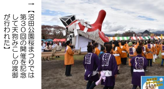
→【沼田公園桜まつりでは第30回の開催を記念して天狗みこしの渡御が行われた】