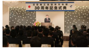
↑【青年部創立30周年記念式典】