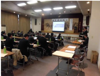
←【通常議員総会。平成30年度の当所事業計画、予算等について審議された】→