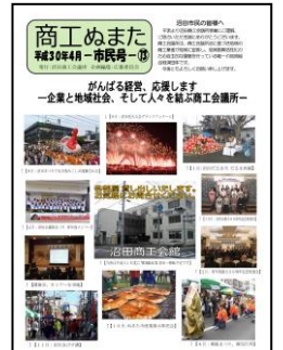
↑【商工ぬまた市民号発行】