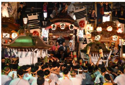
←【酷暑の中行われた沼田まつり】