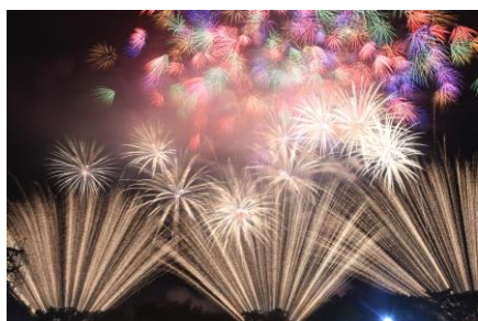
←【悪天候の中沢山のお客様にご来場頂いた第6回沼田花火大会】