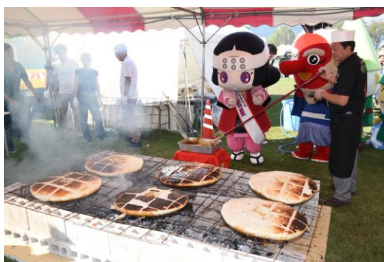
↑【巨大六文銭焼きまんじゅうを焼いた産業展示即売会】