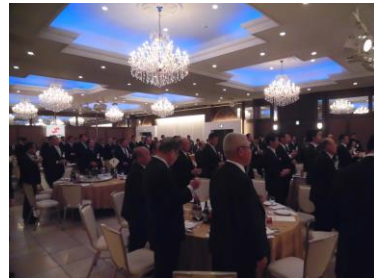
【写真は昨年（平成30年）の新年互礼会の様子】