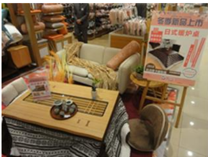
【日本文化・親日的ディスプレイ】