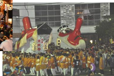
【沼田まつりの名物天狗みこしは今年も2基渡御された】→