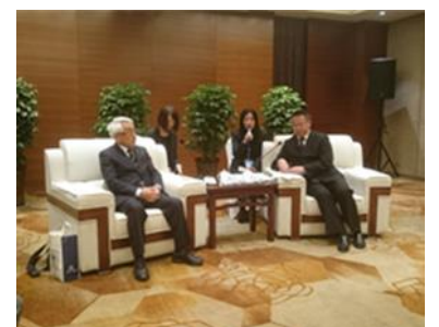
【横山沼田市長と柳江・江油市長（右）】