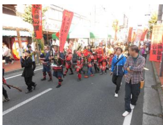
↑【上州沼田真田まつり】