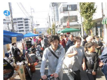
↑【大商業祭と沼田系びす講が同時開催された】