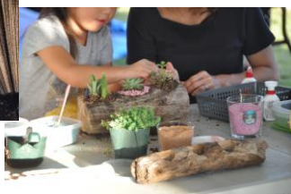
↑【新規イベントとしてワークショップを開催】