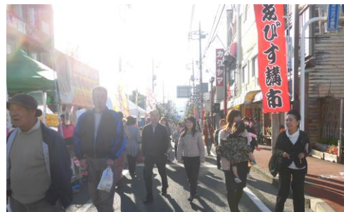
【今年のゑびす講の様子】