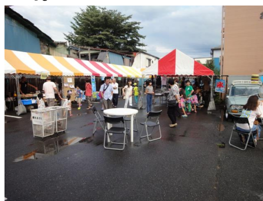
【右：当日の雨上がりの様子】

8月14日(金)に群馬県企画提案型事業「おかえりナイトバザール」が六斎広場にて開催されました。普段なかなか会う事が出来ない、ご親戚、ご友人との集いの場として企画致しました。様々な物産・飲食店が並び当日はあいにくの雨でしたが雨があがった後半には沢山の方々にご来場頂きました。ありがとうございました。今後も皆様が楽しんで頂けるようなイベント等を企画していきたいと思っておりますので、宜しくお願い致します。