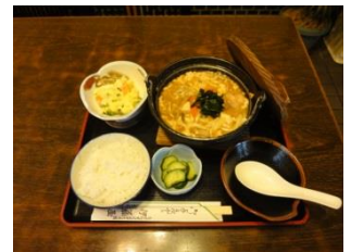
おっきりこみうどん

沼田市馬喰町1277-12 電話番号 22-4811 営業時間 10:00~19:00 定休日 木曜日