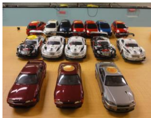
【日本一のスロットカーサーキットコース場です】