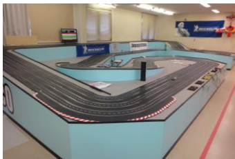
【無料でレンタルしています】