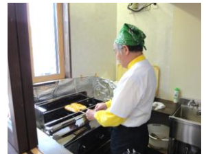
【注文をいただいてから店主が焼くので、いつも焼きたてが食べられます】

商売のもとには人であると、長年のお勤めから自営業者になるというチャレンジ精神と本町通りに対する愛情の熱さを感じさせる訪問でした。憩いの場として味を提供し、新しいコミュニティの確立に期待しています。