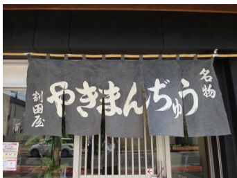
【ご両親が開業していた時の暖簾だそうです。時代を感じます。この日が来るのをじっと待っていたようです。】

職種は違いますが、基本的には人と接する仕事は同じなので大変な事はないです。今まで接客業をしていて、初めて自分のお店で接客するので何か不思議な感じで新鮮です。気兼ねのいらぬ商売なのでお客様は身構えずに、いろいろと好きなことを世間話の中で何でも話してくれるのでほっとします。お店を開いて一番楽しいのは、いろんな方と会話ができることです。沼田に戻ってきてホテルで手伝いをさせていただいて多くの人達と知り合えました。た