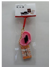
【大人気の『栗ようかんストラップ』です】

ようかんストラップ』を発売しました。高校生や若い人達が喜んで買って下さいました。第2弾は考え中です。