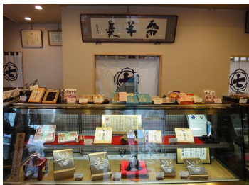
【清潔感のある暖かさを感じるお店です】

創業115年になりまして、ありがたいの意味と皆さんを笑顔にしたいという思いを込めて、ピンク色のハート形のお皿に栗ようかんが乗っている『栗