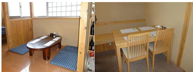
【店内はおちついた雰囲気、ゆっくり楽しむことができそうです】