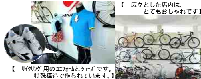
【サイクリング用のエフォームシューズです。特殊構造で作られています。】

健康の為にみなさんも自転車に乗ってほしいですね。私は、ロードレースの一種でヒルクライムに参加しています。ヒルクライムとは、登坂競技のことで、山の登り坂に設定されたコースを走るレースでゴールが頂上にあります。はじめはきついです。終わった後の達成感はとても気持ちが良く感動します。仲間も増えて、毎朝練習で30kmから40km走ってから仕事に行きます。朝は涼しく、空気が凄く気持ちいいです。