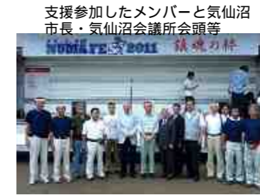
支援参加したメンバーと気仙沼市長・気仙沼商工会議所会頭等