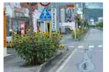
被災地復旧後 大きく育ったひまわり