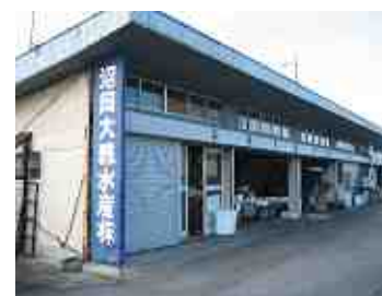
【朝、早くから開店しています】

魚屋なので技術力を生かして、加工はすべて手作業で行っています。同じものが同じ値段で流通している中で、他店と差別化するには、心をこめて自分達でやれることはやっていこうと思っています。