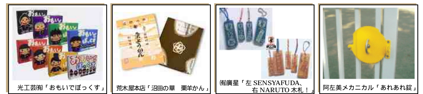
光工芸館「おもいでぼっくす」