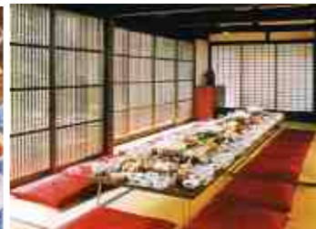
【このようにセッティングしてくれます】