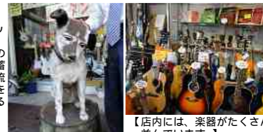
【店内には、楽器がたくさん並んでいます。】

【名前はニッパー君です。エンジンの飼いで、蓄音器から流れる名曲を聴いているようです】