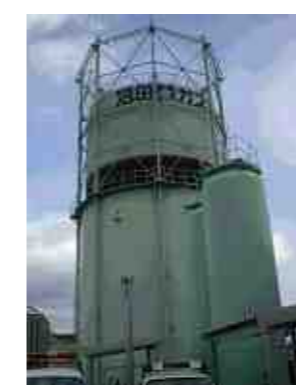
【沼田ガスのシンボルです】

- 今までで大変だったことを教えてください。 国の指導もあり、全国の都市ガスの熱量を高カロリー