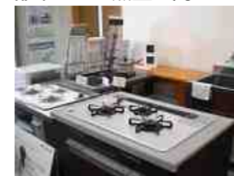
【店内には、最新式のガス台が展示してあります。】

- ガスに統一する動きが全国で始まり、平成7年頃に関東の17社が共同で行うことになりました。作業を進める中、沼田でも120～130人が約半年かけて作業を完了しました。熱量変更には膨大な資金と人員が必要でした。桐生ガスさんには全面的な支援を頂きました。あのときは、本当に大変でした。