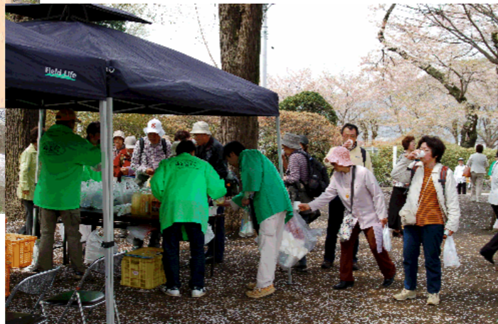
観光協会青年部のサービスコーナー 「地元産のリンゴジュース」の配布 (沼田公園)