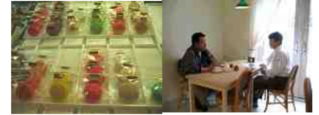
【大人気のマカロンです】