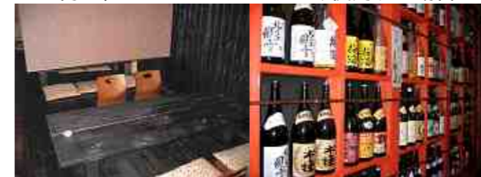
【仕切をとると80人は入れる大広間になります】 【お酒の種類も豊富です】

大広間は最高80人が入れますので、いろいろなイベントに使っていただいています。2階には、カラオケ付きのパーティールームもありますので、2次会として利用するととても便利です。1階で飲んでいただいた方には、1人1時間1,000円で、パーティールームのみ使用する場合は