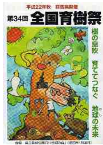
【全国育樹祭のチラシ】