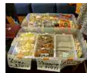
【お菓子も販売しています】