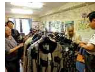
【出張商店街の様子です。皆さん楽しそうです】

出張商店街として老人ホームに伺っていますが、皆さん楽しみに待っていてくれます。自分で選んでものを買うということの楽しさはいくつに