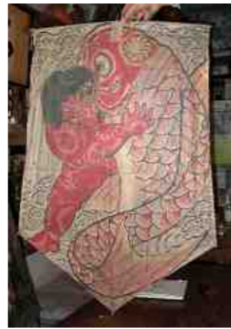
【93cm x 56cm】