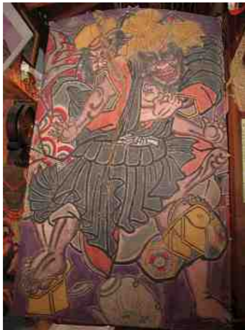
【156cm x 98cm】