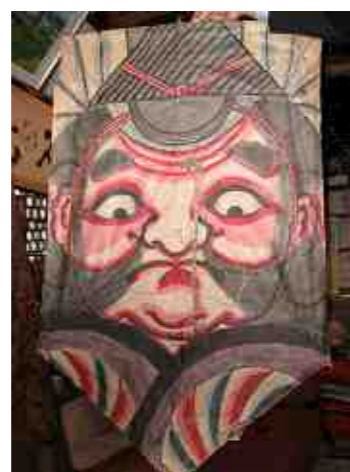
【115cm x 70cm】