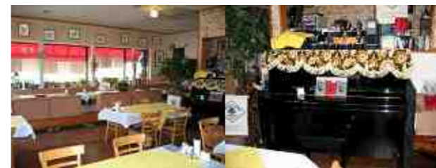
【清潔感のあるとても可愛い店内です。】

昨年の秋ぐらいから、年4回季節ごとにイベントを行っています。食を紹介するイベントを、