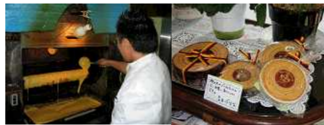
【バウムクーヘンはこうして作られます。太いものでは、3日かかるそうです。】 【吉本ばなさんが「本物のクーヘンだ」と絶賛したバウムクーヘン各種】

私が、継ぐ3年ぐらい前のことだったと思います。私、吉本ばなさんは旅好きの温泉好きで、たまに、こちらに旅行に来たときに立ち寄られて、バウムクーヘンを食べたら、すごく気に入って