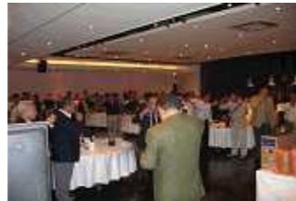
【パーティ会場の様子】