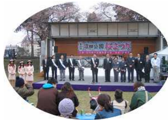
【開会式の様子】 【気球の大きさ：高さ25m 直径20m 容積3000m 3 籐のバスケットに乗って】

同時に「沼田茶道会」によるお茶会が旧土岐邸洋館にて開催されました。土岐氏は、清和天皇を祖とする源氏の一族で、江戸になってからは大坂城代・京都所司代・老中などを務めた名門です。土岐頼稔(よりとし)公が寛保2(1742)年、黒田氏の後を受けて初代沼田藩主となって以来127年間、12代藩主頼知公が明治2年に版籍奉還するまで利根沼田の主要地域を治めていました。明治4年に沼田を離れ、東京に転居した土岐家は明治新政府から子爵に叙せられました。この洋館は、土岐章(あきら)子爵が関東大震災後の大正13年に東京渋谷へ転居する際に、住宅の主要部分として建築された建物です。現当主の貴光氏より、ゆかりの深い本市が寄贈を受け、平成2年に沼田公園へ移築しました。(沼田市ホームページより)