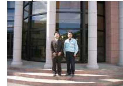
津久井塾長(左)と金子委員(右)と自然を味わう前にたのまわりの社屋にて