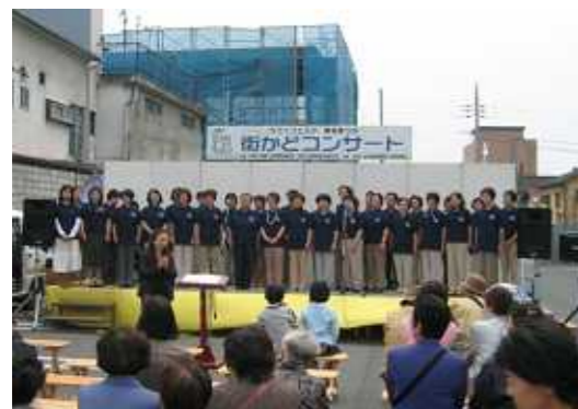
【街かどコンサートの様子】