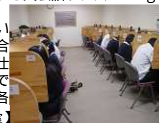
【集中できるよう工夫された自習室】

種イベントを通じた異業種交流が出来る点もこのクラスの特徴です。又、講師派遣も行っており、ご希望の企業や幼稚園への出張レッスンも承っておりますのでこちらも是非ご利用下さい。