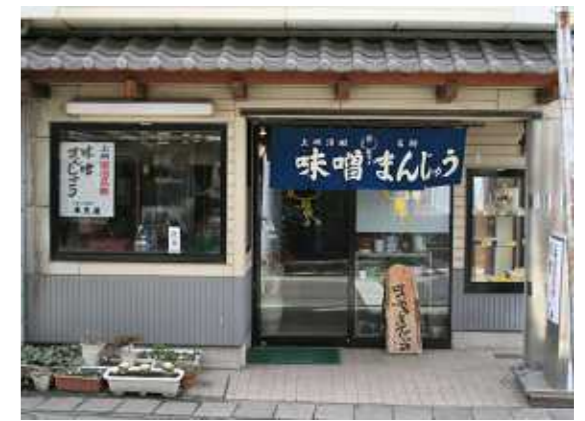
【味噌の香ばしい香りが漂います】

当店は文政8年(1825年)に創業し、当店独特の風味は長年受け継がれた製法で皆様からご愛好いただいております。上州の代表的名産として好評を博し全国各地より御需用を賜っております。御家庭の日常の茶時の友として、また、御土産に御贈答に、東見屋の味噌饅頭を