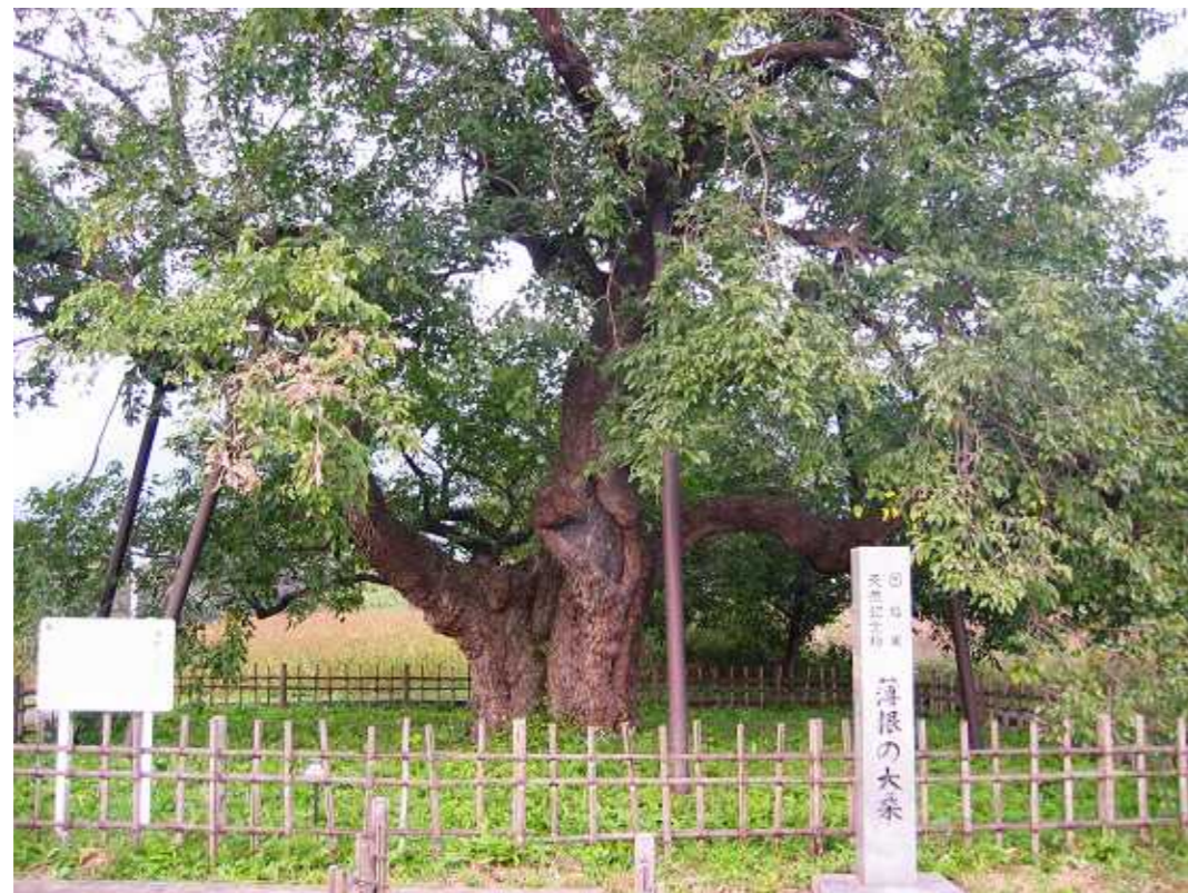
薄根の大クワ

畑地の中にあるヤマグワで、よく茂り樹容は美しい。ヤマグワでは日本一の巨樹である。目通周囲7.97m、樹高13.65m。樹齢は推定1500年。真田伊賀守が幕府に領地を没収された後、貞享三年(1686)に幕命で前橋藩の家老高須隼人が石墨村を再検地した際、この大クワを検地の標木にしたと言われている。幹が太く容姿端正なことで、「養蚕の神」として永くたたえられてきた。