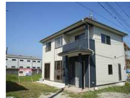
【現在分譲中の新築住宅(材木町)】

『団楽を創る家「クリアール」』という自由設計システムの住宅をおすすめしています。これは耐震耐久性 断熱性 安全性を備えながら、なおかつローコストを実現した工法で、このシステムなら家計に優しい無理のない家づくりが可能です。今なら、この材木町の分譲住宅を参考にご覧いただけます。