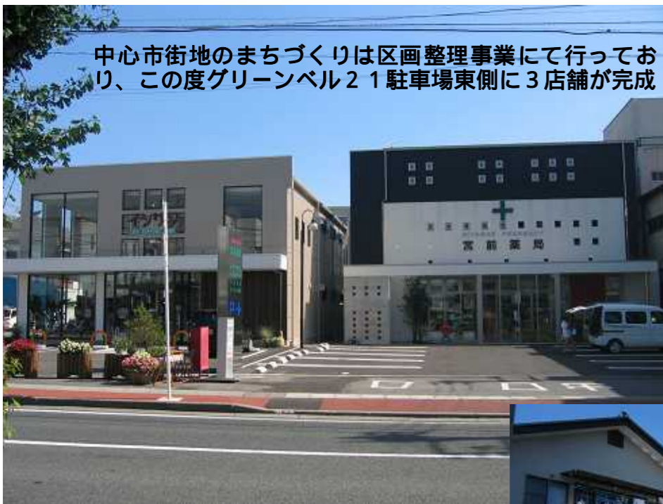
中心市街地のまちづくりは区画整理事業にて行っており、この度グリーンベル21駐車場東側に3店舗が完成