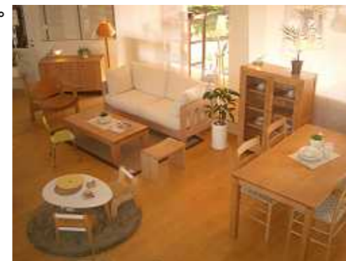
【interior studio arterior 店内風景】

昭和27年に創業、左官資材の販売から始まり建築資材、設備資材を扱うようになりました。日本の住宅がインテリア性の高いものを求める時代となることを予期し、インテリアアタイル等の輸入建材販売を目的として、昭和50年高崎支店アーテリアニシダ(アーテリアという言葉はないのですが、アートとインテリアを合わせてつけました)を開設、その後タイル・塗床・金物などの建築仕上げ工事を扱うと共に、暖炉・サウナといった県内では先駆けとなる分野へも取り組んできました。昭和58年にシステムキッチン・システム家具等をお客様に提案販売するヤマハホームショップを開設、現在はinterior studio arteriorとしてヤマハの商品に限らず、ドイツ製のシステムキッチン、ボーゲンポールやこだわりを持ってセレクトした家具・雑貨・照明・薪ストーブなどを取り揃え、室内のグリーンプランニングからエクステリアプランニング施工までお客様のニーズに合わせてアドバイザーによるコーディネートを行う、総合的な空間提案を行うショップとなっています。