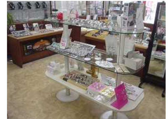
【最新の眼鏡や補聴器・時計が並ぶ店内】

当店は昭和13年に下之町キネマ通りにて創業し、昭和38年に有限会社となりました。昭和46年より現在の上之町にて営業しています。創業以来の時計販売・修理業に加え、現在はメガネ・補聴器の販売を中心に営業しております。遠近両用レンズをはじめとした最新設計レンズのご提案や、最近話題のデジタル補聴器の取り扱いにも力を入れております。「見る」悩み、「聞こえ」の悩みをお持ちの方は、是非ともお気軽にお問い合わせ下さい。