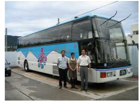
【大型バス・スーパーハイデッカー車の前にて】

はい。ISO9001は品質マネジメントシステムに係わる世界的に認知された国際標準規格です。従って安定したサービスで顧客満足度を高める為の重要なアイテムとして取得しました。また、昨今地球に優しい経営が求められている中、当社でできる事として“グリーン経営”認証システムも今後取得予定です。アイドリングストップをはじめエコドライブを心がけ、環境に優しい企業を目指します。