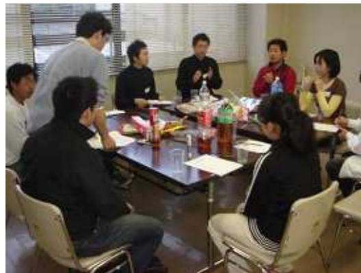
【高校生との検討会議の様子】

今後も“世代間のつながり・思いの循環”が強く・大きくなりもっと多くの高校生が自分達で話し合いそして私達大人に、こんな考えがあるから協力してほしいというような『まちづくり』が出来るようになればと思います。参加者だった子ども達が、地域の中で成長し今度は設営側の高校生となる。設営した高校生は大人となり積極的に地域に係わっている。そして結婚し子ども達を事業へ参加させる。このように地域に対する想いが世代を越えて受け継がれ、いつしかこの地域は誰もが『夢』を持っている明るい豊かなまちになっている。そのための第一歩となるべく運動を行っていきます。